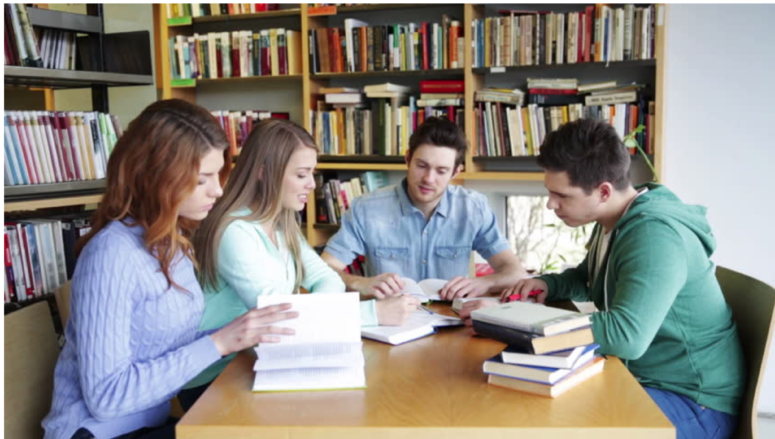
Book Reading: One Woman's Fight to Save Children Orphaned by AIDS / SP / J. Larchevêque

Monsieur Nunez nous conseille pour commencer de lire de petits livres accrochants tels que Voyage autour de ma chambre qui interpelle le lecteur par son originalité. En 2017 au CDI de l'IUT 674 livres ont été empruntés, ce qui n'est pas négligeable. En effet l'IUT de Carquefou est un lieu plutôt technique et peu tourné vers le littéraire et fréquenté exclusivement par les étudiants de IUT. Le nombre d'emprunts dans les bibliothèques universitaires est quand à lui beaucoup plus élevé (plus d'une centaine de livres empruntés par jour), cela démontre que la lecture n'est pas délaissée entièrement au profit d'autres moyens d'information ou de divertissement.