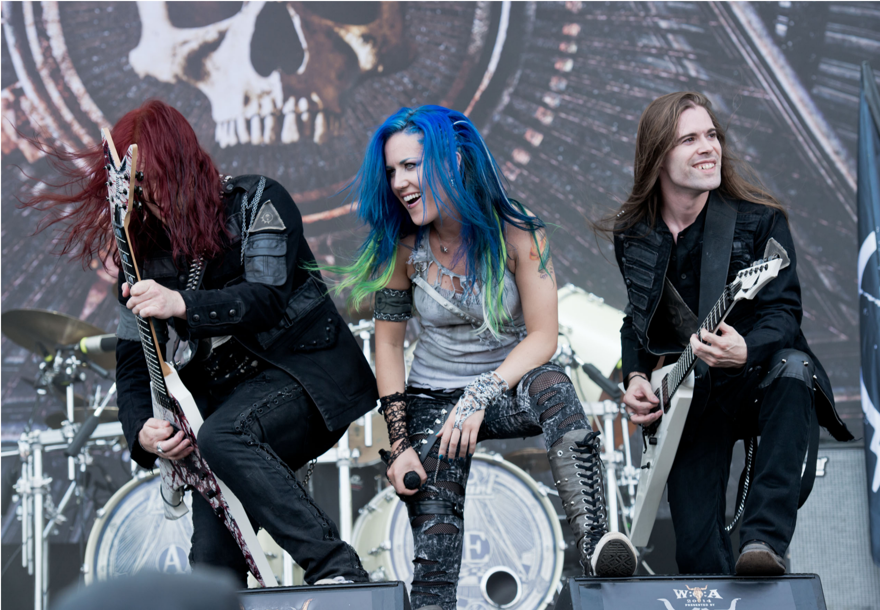
arch-enemy-wacken-2014-0029, 17 janvier 2017