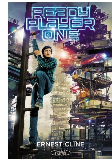
Roman de science fiction écrit par Ernest Cline. Il est adapté au cinéma par Steven Spielberg et sorti fin mars 2018 en France